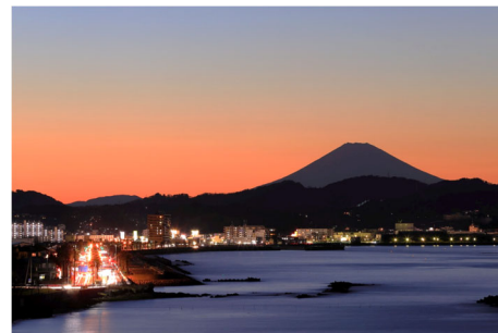
Fig. 3. NMR titration experiments of the bivalent peptide against the wild type Pin1.